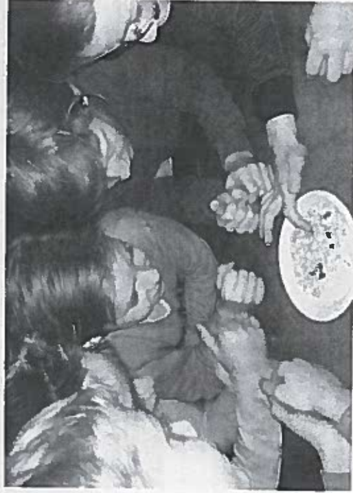
▲ Miesti onderzoek.

De groepen 5 t/m 8 van basisschool de Klokkebei in Ulvenhout zijn de afgelopen weken intensief bezig geweest met het project Amerika (vanuit de zaakvakkenmethode Topondernemers). De verkiezingen, de natuur, cultuur en eetgewoonten. Alles is de revue gepasseerd.